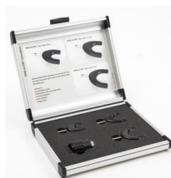
Set aplicadores para columna