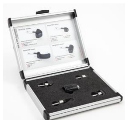
Set aplicadores de fascia