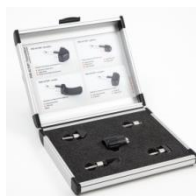
Set aplicadores de fascia