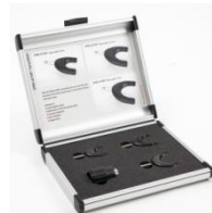
Set aplicadores para columna